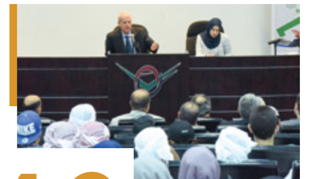
محمد بن حم يناقش مراحل التغيير الاجتماعي لدولة الإمارات