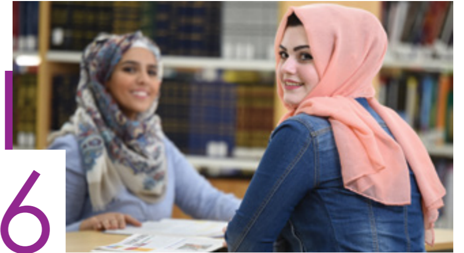
طرح برامج ماجستير جديدة في كلية التربية والعلوم الإنسانية والاجتماعية