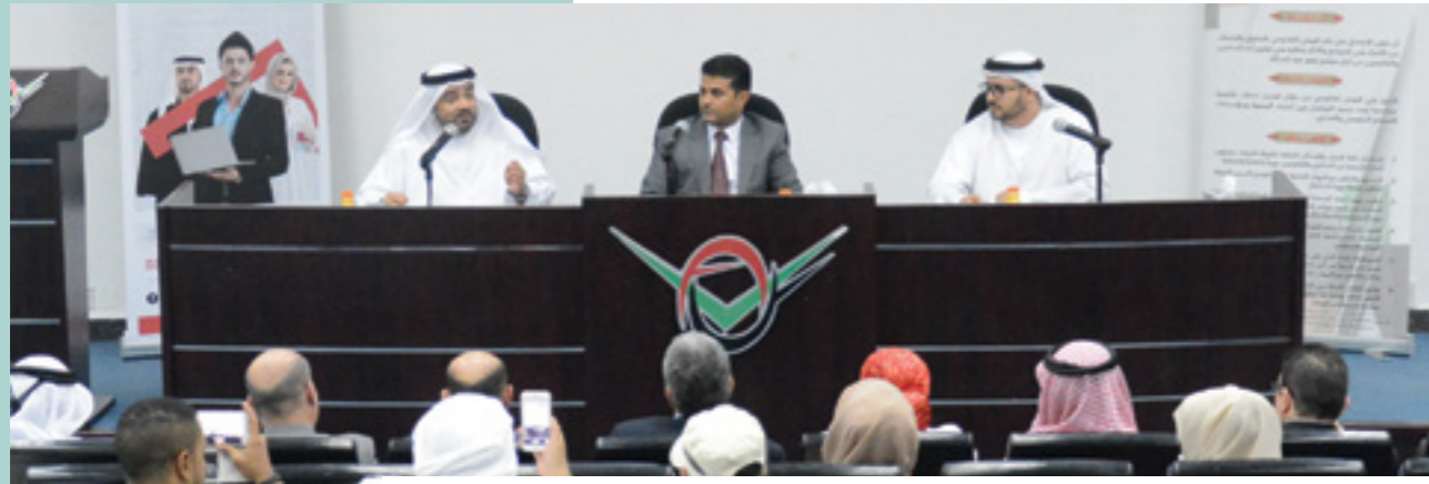
ندوة قانونية بالتعاون مع جمعية المحامين القانونيين