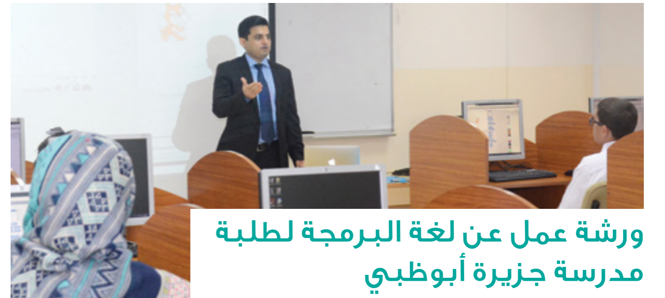
ورشة عمل عن لغة البرمجة لطلبة مدرسة جزيرة أبوظبي