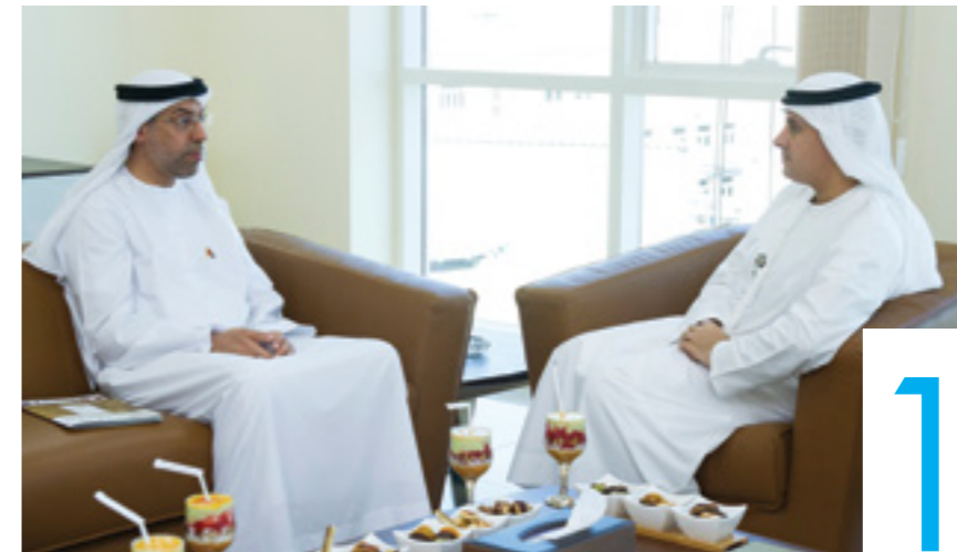
المدير المفوض لجامعة العين يلتقي بالأمين العام للمجلس الوطني الاتحادي