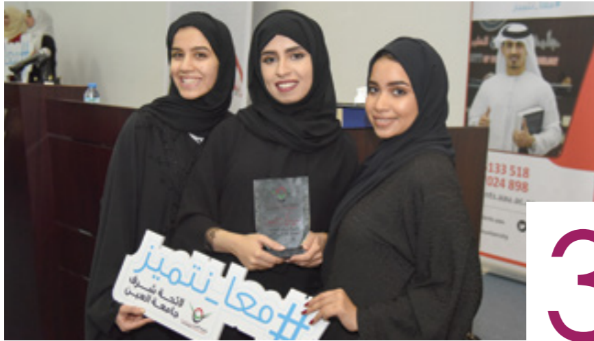
تكريم طلبة لائحة شرف الجامعة