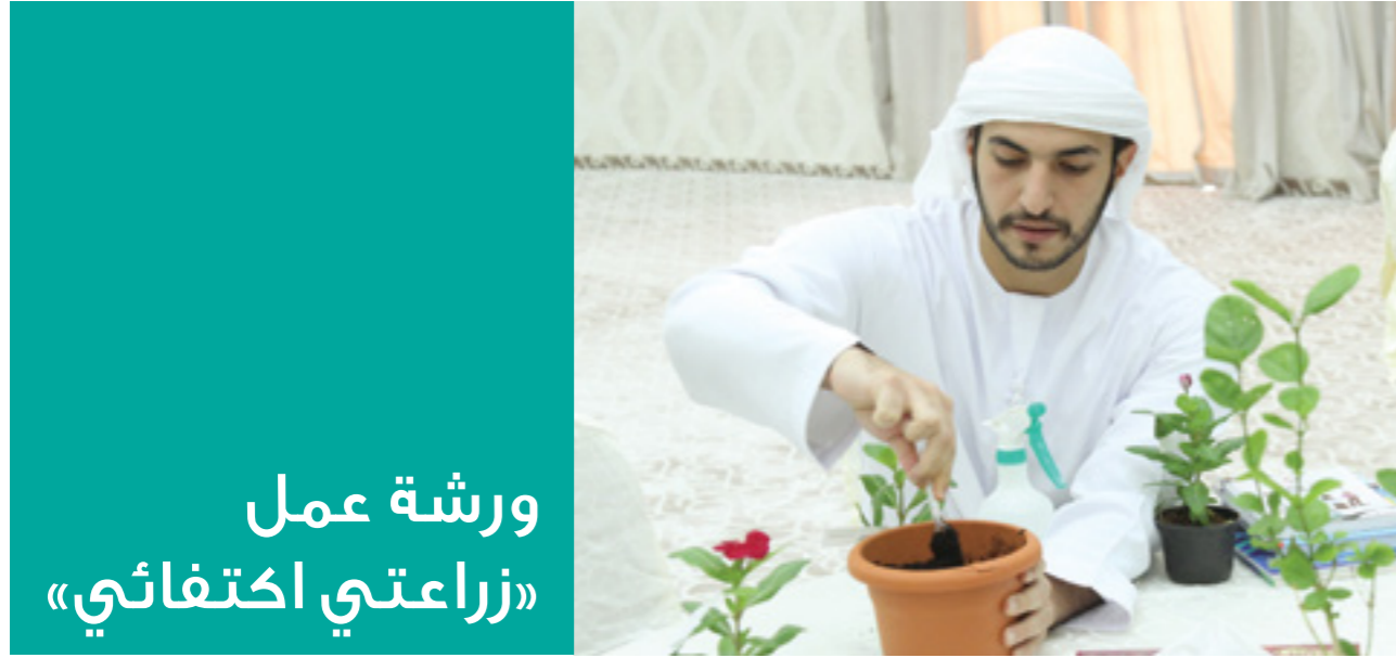
ورشة عمل «زراعتي اكتفائي»