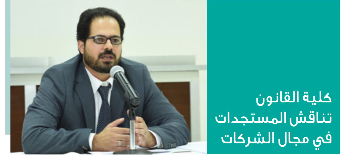
كلية القانون تناقش المستجدات في مجال الشركات