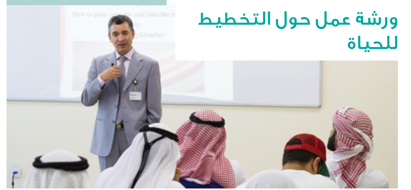
ورشة عمل حول التخطيط للحياة