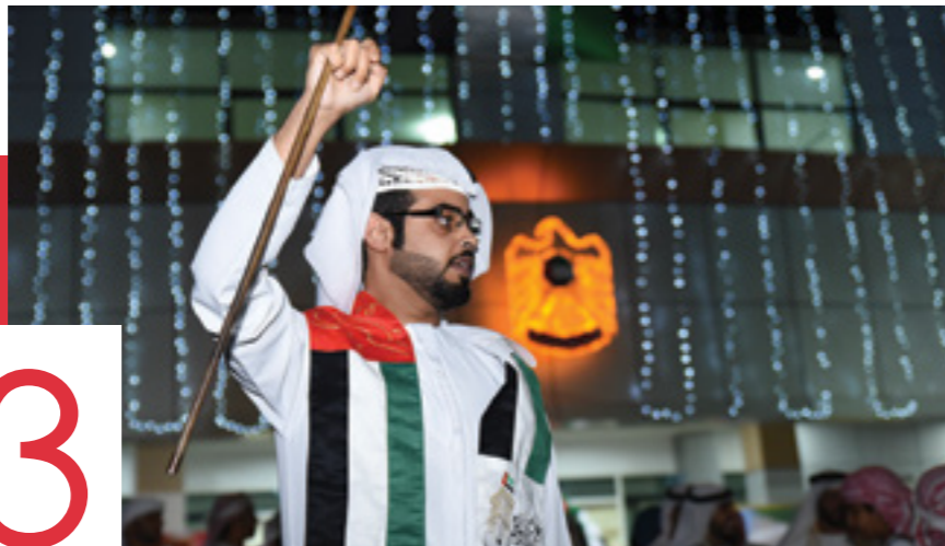
جامعة العين تبتهج باليوم الوطني 46