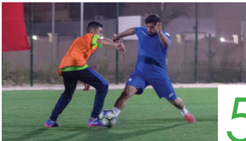
فريق كلية القانون تتصدر بطولة «الاتحاد» لكرة القدم