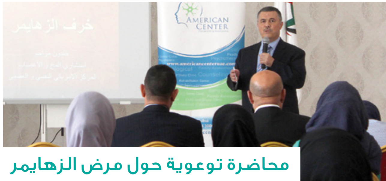
محاضرة توعوية حول مرض الزهايمر